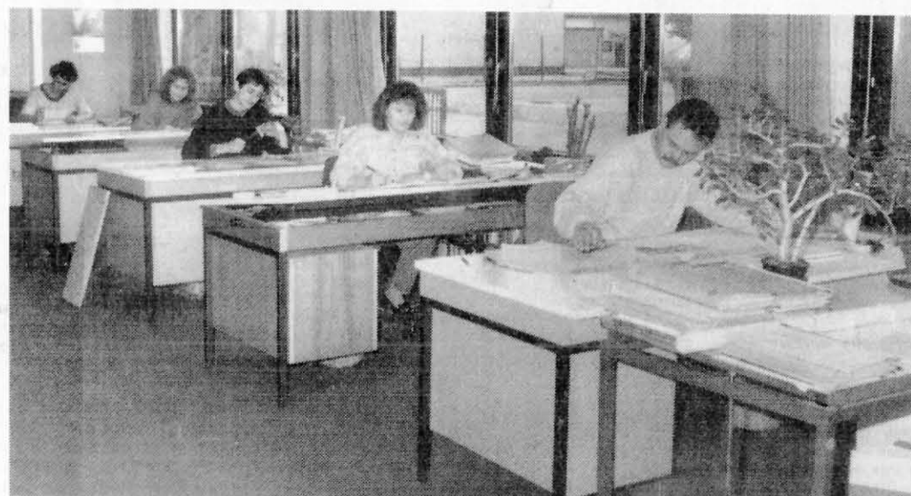
Das technische Büro der AME-Technik GmbH in Hameln.

AME-Technik GmbH feiert 100jähriges Firmenbestehen / Seit 1935 in Hameln