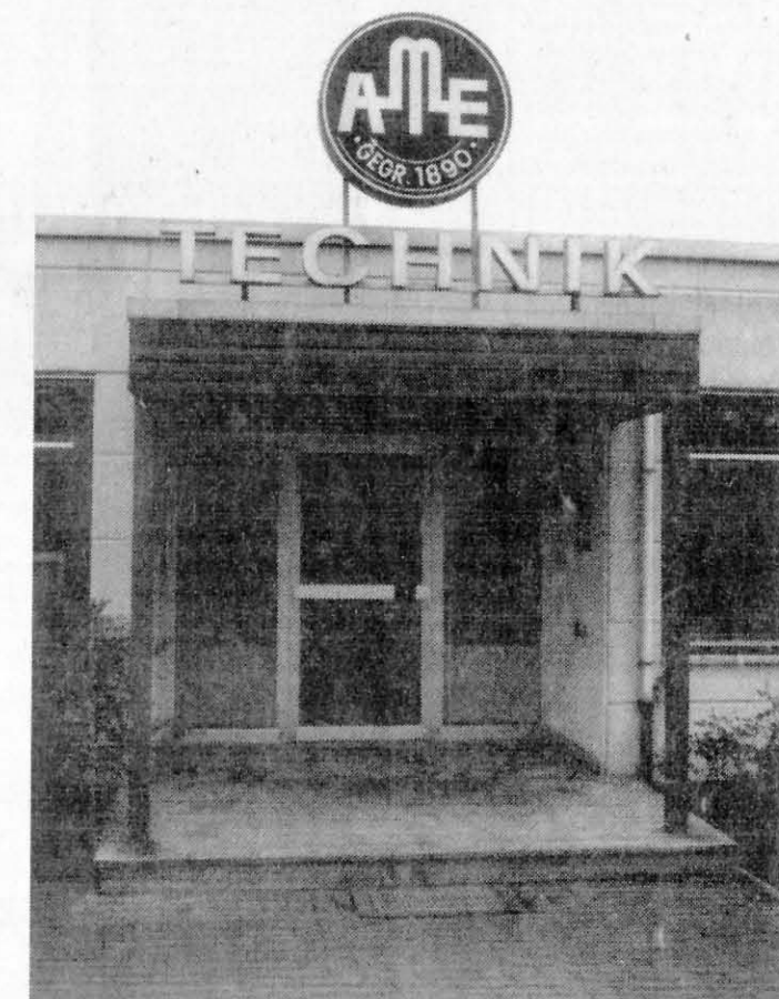
AME-Gebäude in der Reichardtstraße

Und auch die Ausbildung im eigenen Haus wird seit 1970 ganz großgeschrieben: Durchschnittlich werden im Unternehmen, das die DVGW-Zulassung besitzt, acht bis neun Lehrlinge pro Jahr aufgenommen.